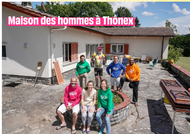
Maison des hommes à Thonex

Nos colocations à Genève et dans le monde