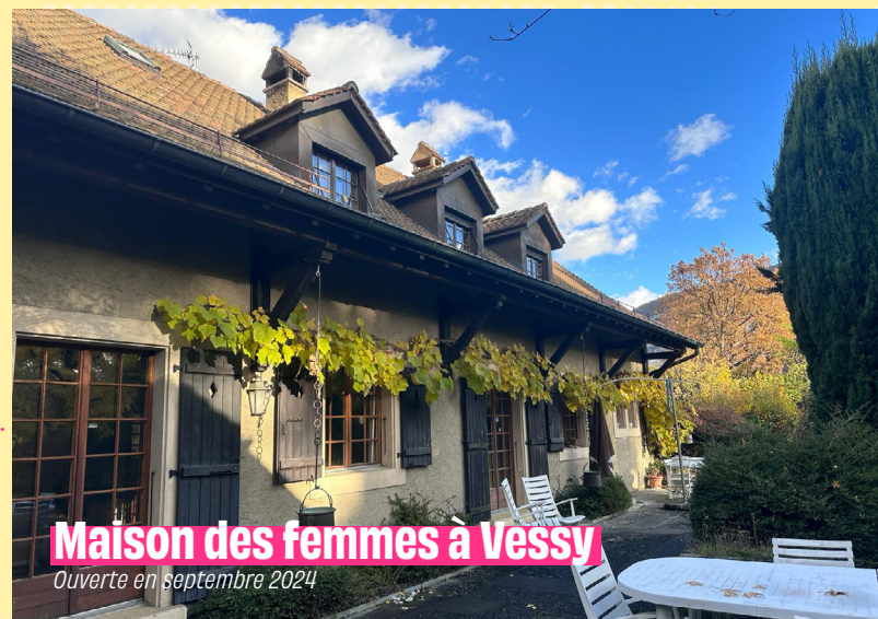
Maison des femmes à Vessy

+ des projets à Fribourg, Lausanne Royaume-Uni, Canada