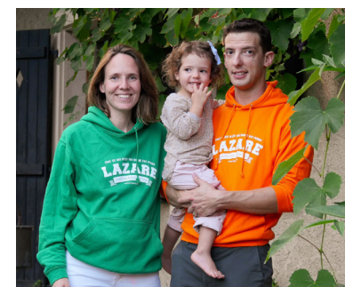
Famille Sentis Maison des femmes