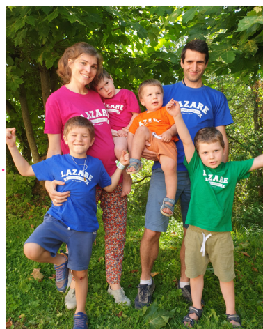
Famille Tabailou Maison des hommes

— Arrivée des nouvelles familles responsables